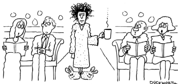
Paní Johnsonová si ještě nevšimla, že bohoslužby už nejsou online.