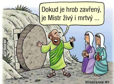
Svatý Schrödinger - zapomenutý apoštol