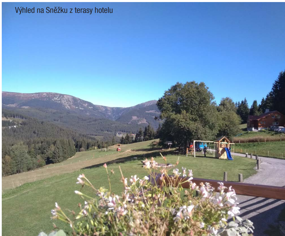
Výhled na Sněžku z terasy hotelu